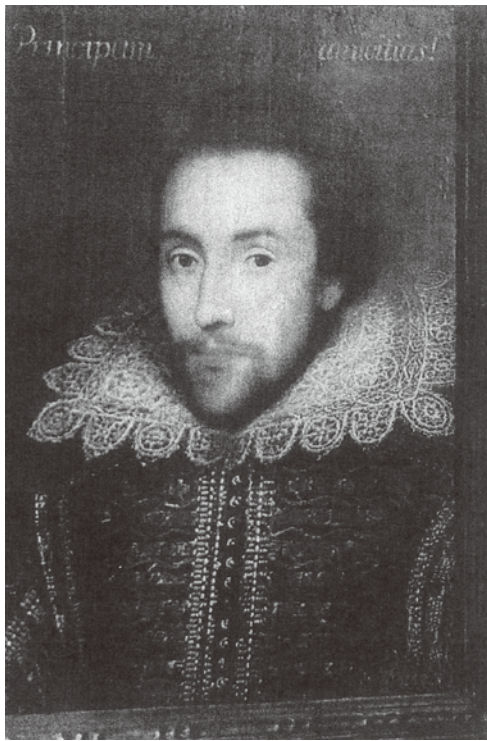
図2 2009年4月に新らしく発見したと発表された肖像画